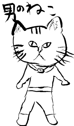
画: 双子の妹 マユ