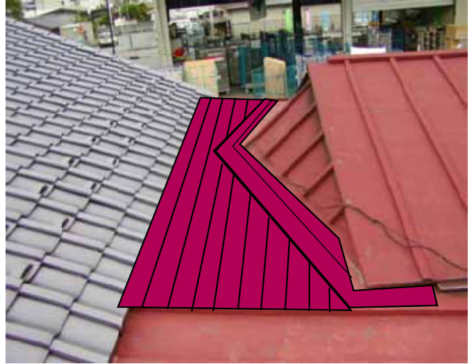
改修後の屋根の予想