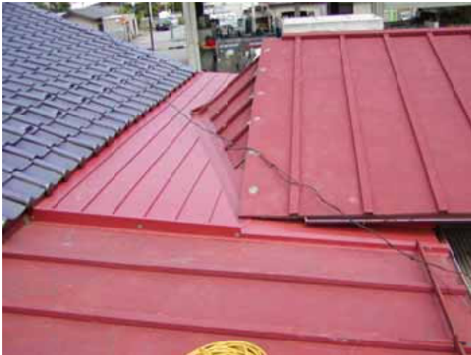
改修工事完了 予想に近い屋根に変わりました