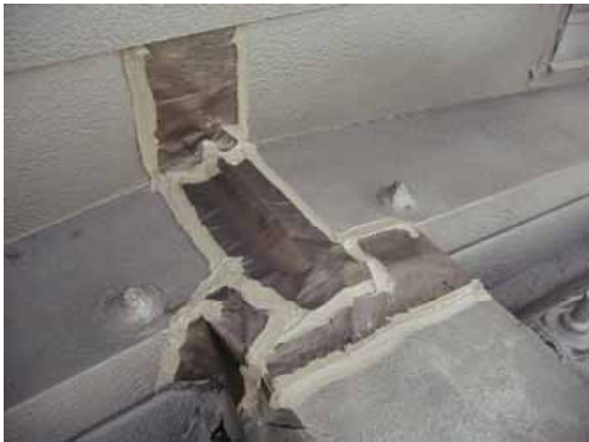
下部の写真 雨漏り箇所上部補修後の写真

対策： 雨水が入っても出やすくする。（17°ロンの下部カット） 上部の漏りそうな箇所を念入りに補修する。